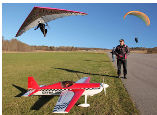
Premiären på Barkarby 28/10 -2012!